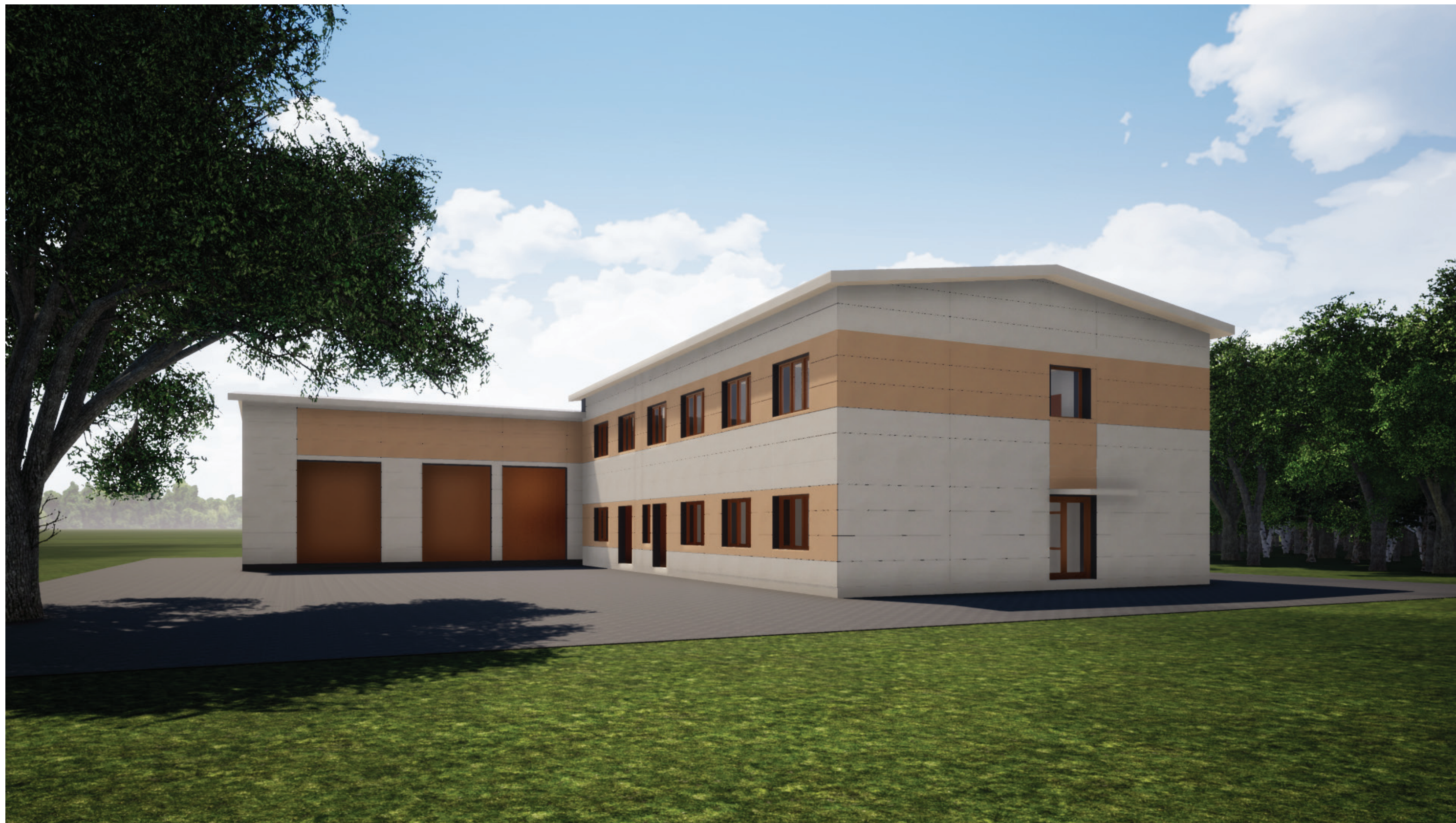
Středisko Okrouhlík – nástavba a stavební úpravy– varianty řešení fasád

DEKCASSETTE IDEAL, výška 650 mm, ELFENBEIN RAL 1014 | SP 25 | 2A97U SAFRANGELB RAL 1017 | SP 25 | 2B324