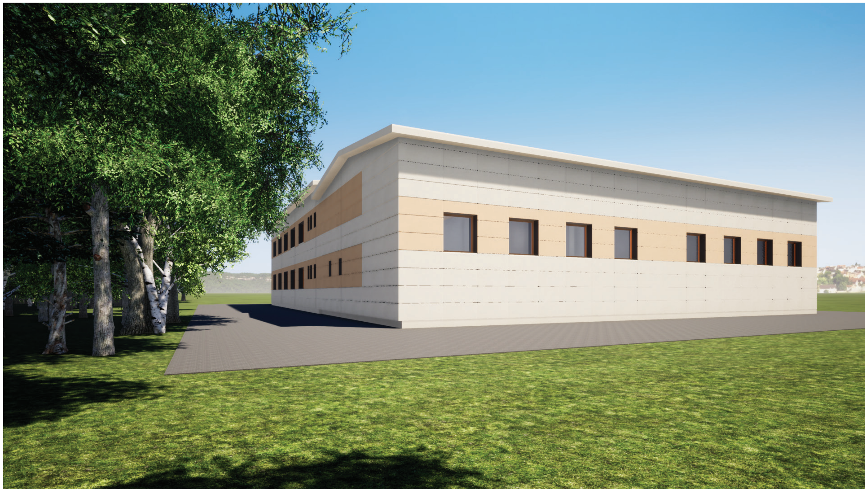
Středisko Okrouhlík – nástavba a stavební úpravy– varianty řešení fasád

DEKCASSETTE IDEAL, výška 650 mm, ELFENBEIN RAL 1014 | SP 25 | 2A97U SAFRANGELB RAL 1017 | SP 25 | 2B324