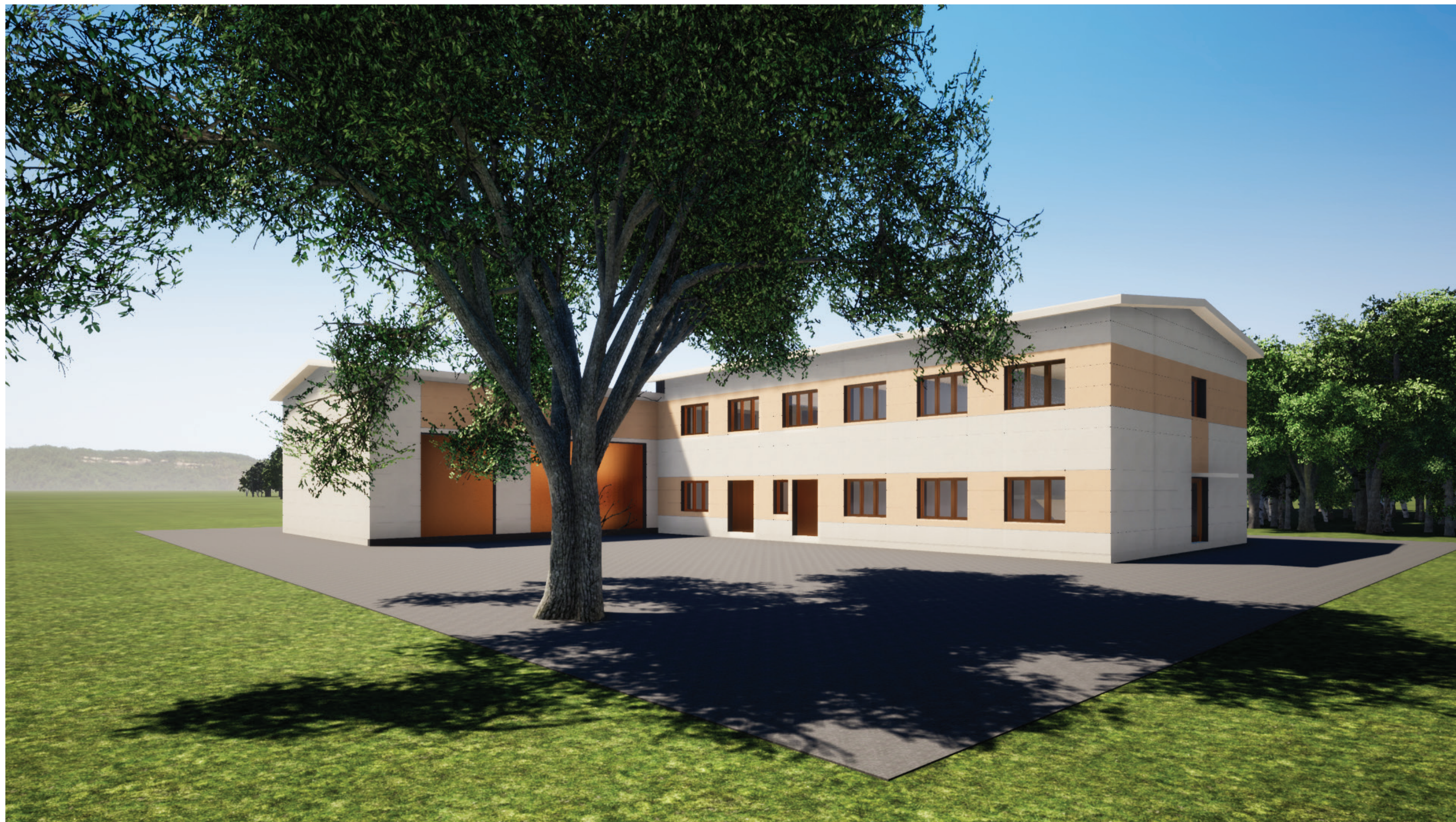
Středisko Okrouhlík – nástavba a stavební úpravy- varianty řešení fasád

DEKCASSETTE IDEAL, výška 650 mm, ELFENBEIN RAL 1014 | SP 25 | 2A97U SAFRANGELB RAL 1017 | SP 25 | 2B324